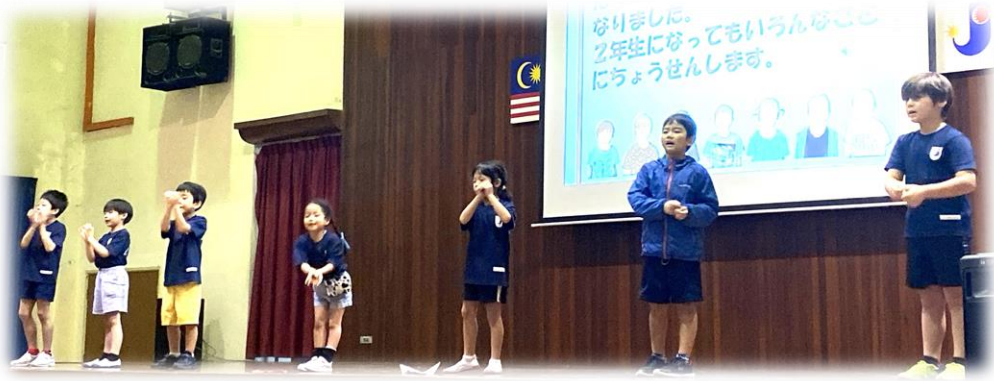
小1「こんなことが できるようになったよ」